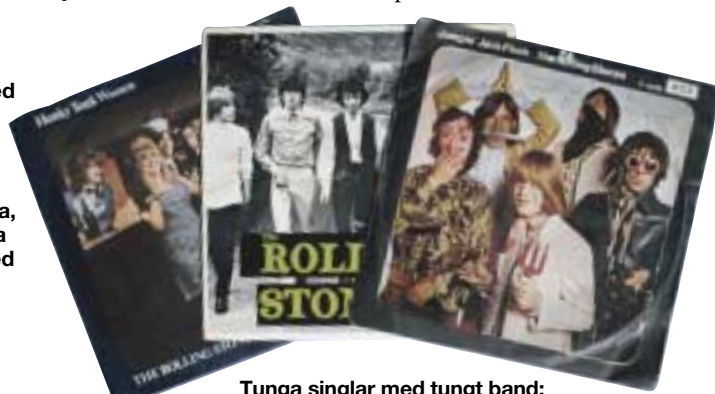
Tunga singlar med tungt band: Honky Tonk Women, The Last Time och Jumpin' Jack Flash.